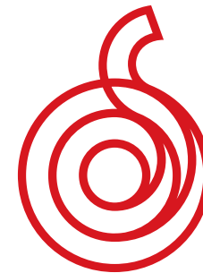
Aomori Ringo Tasty Style

大平デザイン事務所 〒030-0844 青森市桂木2-9-6 101 TEL.017-721-2315 FAX.017-721-2316 e-mail daira54@cream.plala.or.jp