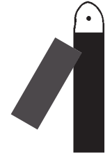
Design Construction 森内建設株式会社

simple, honest, direct, economical, and natural