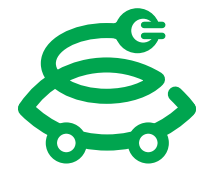
次世代カーライフ