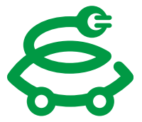
次世代カーライフ